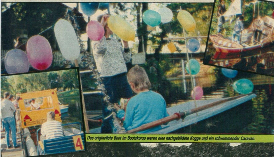
Das originellste Boot im Bootskorso waren eine nachgebildete Kogge und ein schwimmender Caravan.

über rund 80 Kilometer führende Rallye um den „Goldenen Caravan“, der Geschicklichkeitswettbewerb ‚Fahrender Ritter‘ (im Foto mehr dazu), das Wettangeln (für Frühaufsteher), ein Volleyballturnier, und am Pfingstsonnabend verwandelte sich der Bootsverleih am Adolf-Mittag-See in ein Terrain „schwimmender Bühnenbildner“. Es ging darum, das originellste Kähnen herauszuputzen.