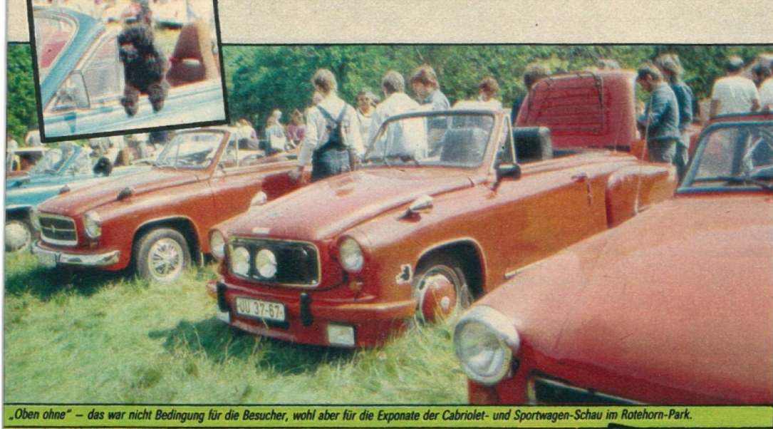
„Oben ohne“ – das war nicht Bedingung für die Besucher, wohl aber für die Exponate der Cabriolet- und Sportwagen-Schau im Rotehorn-Park.